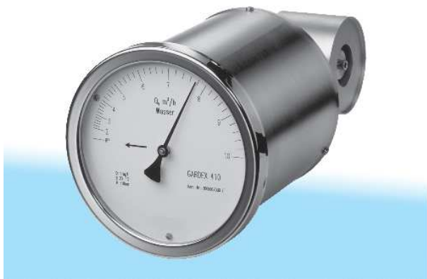
Fig. 1 Débitmètre F I Gardex