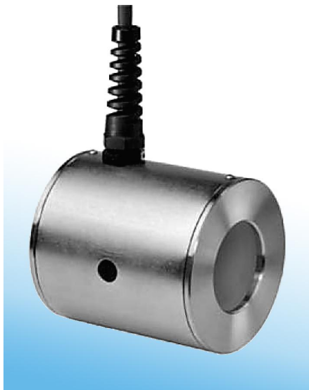
Figure 1 Capteur de débit magnéto-inductif mag-flux S