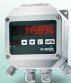
affichage DEL MD 10.010 / 015 boîtier mural