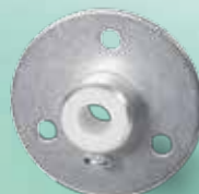
bride de montage