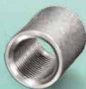
manchon à souder