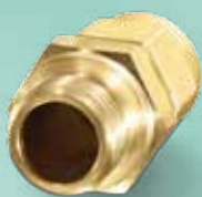
raccord de passage