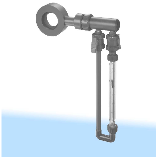
Fig. 1 Débitmètre à diaphragme F O N4